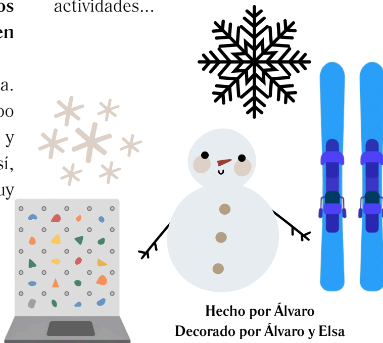
Hecho por Álvaro Decorado por Álvaro y Elsa