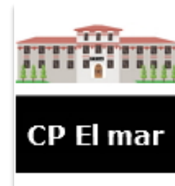
IMAGEN PEQUEÑA (ICONO NOTICIA)