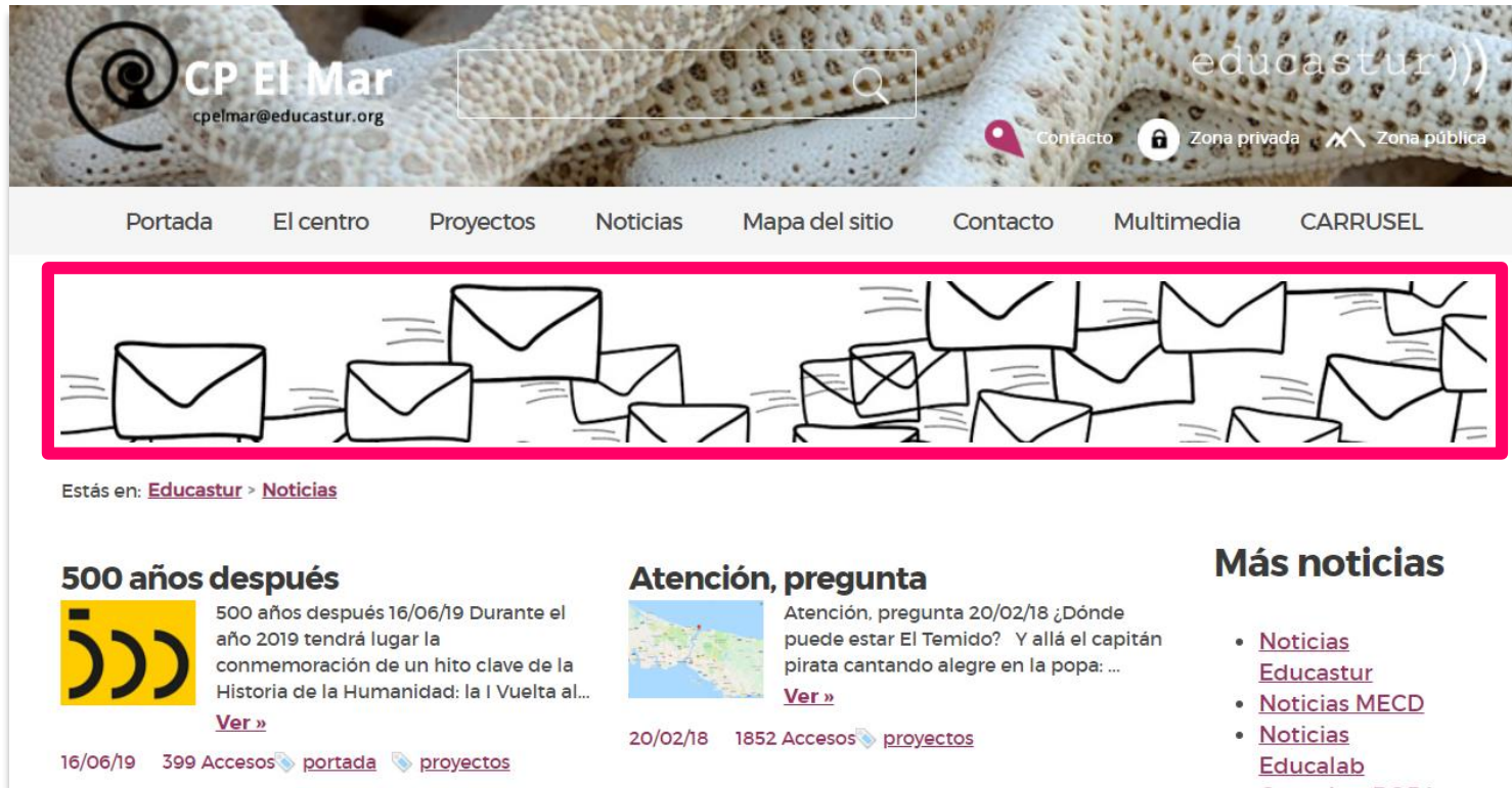
IMAGEN DESTACADA (PÁG./SECCIÓN)