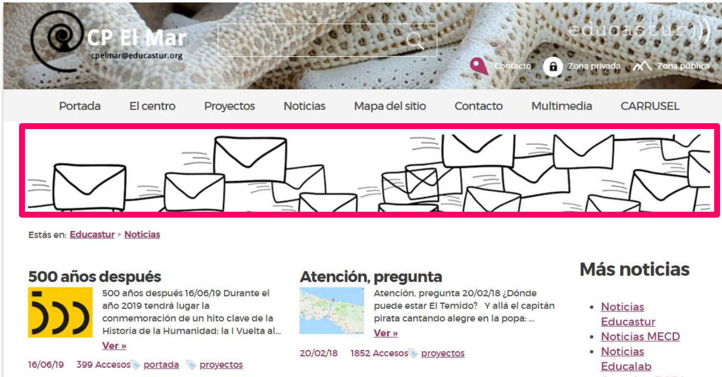
IMAGEN DESTACADA (PÁG./SECCIÓN)