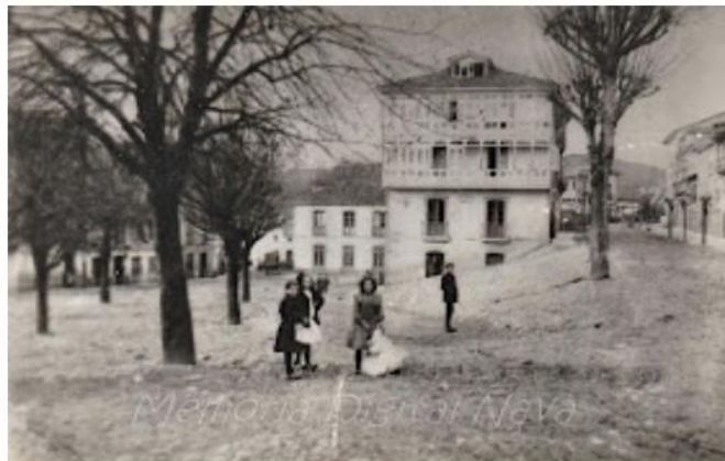
La Plaza 1910

une ville très ancienne, elle a du prestige comme le cimetière de la Haute Moyen-âge ; oui, ce n'est qu'aux X, XI et XII siècles que l'on peut en déduire que la ville existait déjà sous le nom de Nava. Déjà le 22