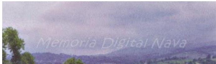
Piscina Municipal en 1999