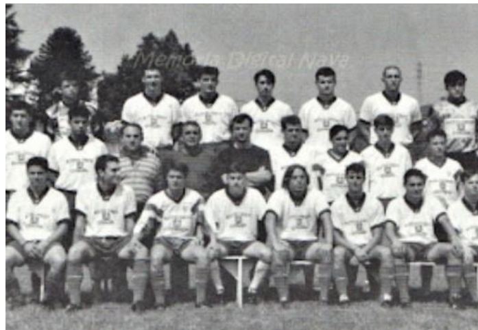
Europa de Nava temporada 1994/95

En el antiguo campo de fútbol, Grandiella, donde el equipo local, "Europa de Nava", jugaba sus partidos. El equipo fue fundado en 1940. Uno de sus mayores logros fue el haber disputado una ronda de la Copa del Rey en 1982, cayendo eliminado por el Real Oviedo.