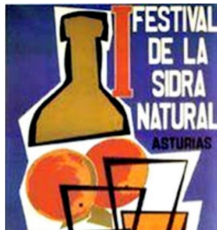
Cartel del primer Festival de la Sidra 1

Chaque second weekend de juin, à Nava, il a lieu l'une de plus grandes fêtes des Asturies, pleine de concours comme le prix au meilleur cidre de l'année et le prix au meilleur verseur de cidre. Et quoi est-ce qu'on doit faire pour gagner le prix au meilleur verseur de cidre ? D'abord, Tu dois connaître l'art de bien prendre le verre. Tu dois le prendre entre les doigts pouce et index en appuyant le doigt majeur sur la