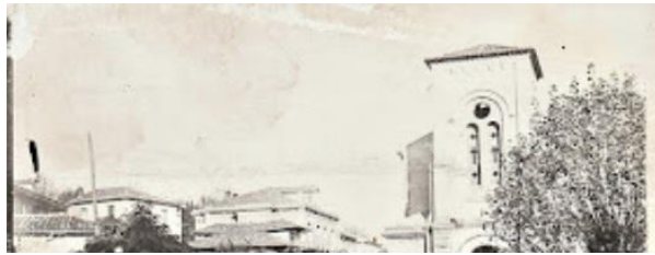
Mercado en la década de los 30 foto : colección Ricardo Fernández Alonso.

Los tiempos cambian, y nosotros y nuestras costumbres también, por eso el mercado de los sábados que conocemos hoy en día no era como el de antes, y es que Nava hace poco más de 40 años contaba con dos mercados. Como dijo Francisco Vega González, el mercado de "les vaques" que se celebraba los sábados donde ahora está la calle de San Cosme y San Damián y el mercado de "mujeres" que se celebraba en el mismo lugar en el que se sitúa el actual, en la plaza, y venían mujeres con burros desde Sariego y Valdediós a vender frutas, verduras y hortalizas.