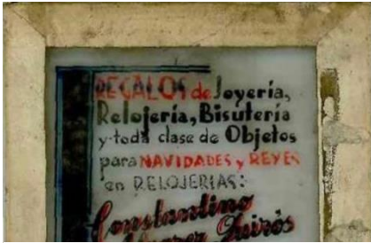
Reproducción de cristal con anuncio de película

Marta Portal nació el 19 de agosto de 1939 en Nava, estudió en el colegio de San Vicente de Paul de Gijón, posteriormente se trasladó a Madrid para continuar sus estudios, aunque los dejó para ingresar en el Cuerpo Oficial de Intérpretes Informadores del Ministerio de Información y Turismo, donde conoció a Miguel Cadenas, con quién se casó en 1953. Tras casarse, volvió a Madrid y lanzó su gran éxito literario, la novela A tientas ya ciegas, que más tarde ganaría el Premio Planeta.