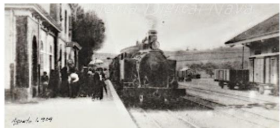
Estación de Nava en 1909

Le train est arrivé à Nava le 13 novembre 1891, où le service a commencé sur la voie qui reliait Oviedo et Piloña. C'était un avant et après pour la commune, puisque cette nouvelle machine, qui se déplaçait plus lentement que la précédente et soufflait de grandes quantités de fumée sur son passage, permettait aux navetos de se déplacer de Nava vers d'autres endroits,