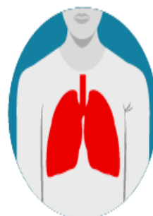
Dificultad para respirar**

*Las personas infectadas no necesariamente presentan todos los síntomas. En algunos casos, pueden no tener ninguno.