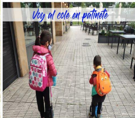
Voy al cole en patinete