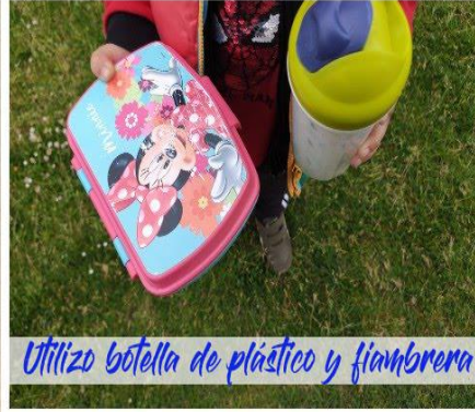
Utilizo botella de plástico y fiambarrera