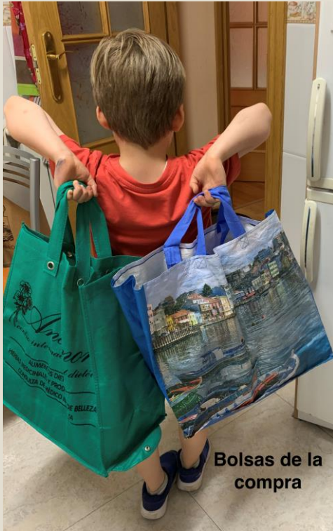
Bolsas de la compra