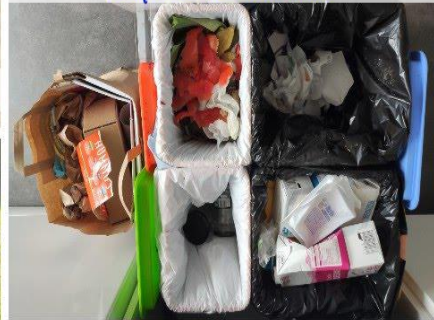
Separo los residuos