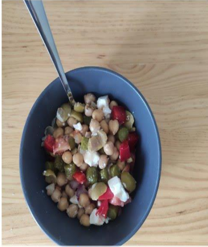
No como carne