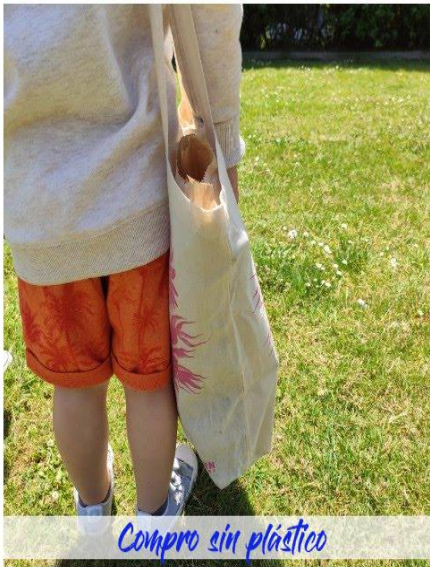
Compro sin plástico