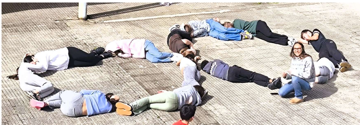
Alumnado 2º A ESO