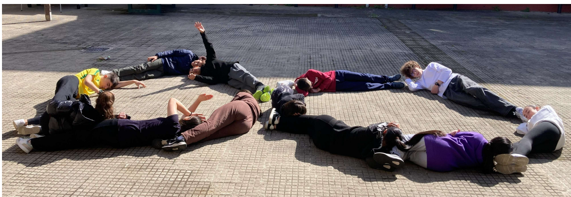
Alumnado 2º D ESO

Para terminar la actividad, los alumnos se colocarán formando el símbolo del infinito ( \infty ). Esto representa que el número \pi es un número irracional, tiene infinitas cifras decimales. Se realizará una fotografía del grupo formando este símbolo como recuerdo del Día de \pi .