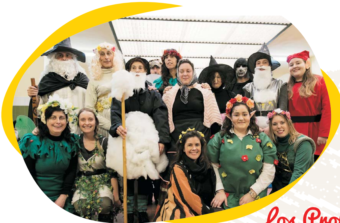
Los Profesores y Profesoras