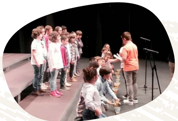
Foto 3. Y, por último, en el Casino de Lieres, asistimos a un concierto didáctico de un quinteto de viento que vino precedido por el trabajo en clase del alumnado, tanto en el conocimiento de instrumentos como en el de obras y compositores.